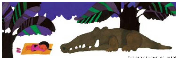
【みんながおしえてくれました】 絵本館