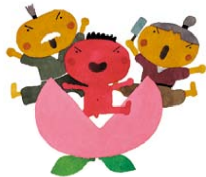
【ももたろう】 絵本館