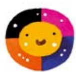
【ももたろう】 絵本館