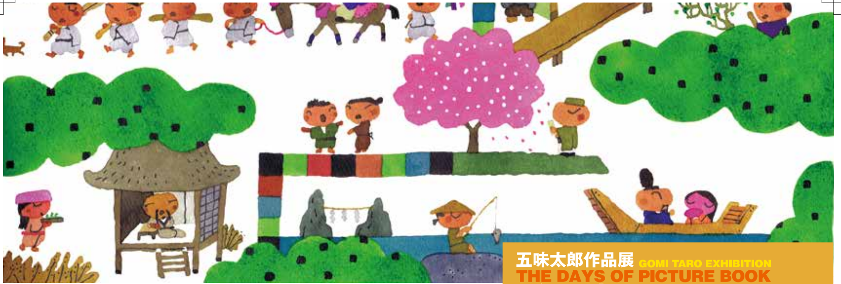
「百人一首ワンダーランド」2014 東京書籍