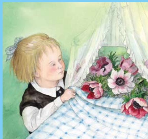
「イーダちゃんの花」2004 小学館