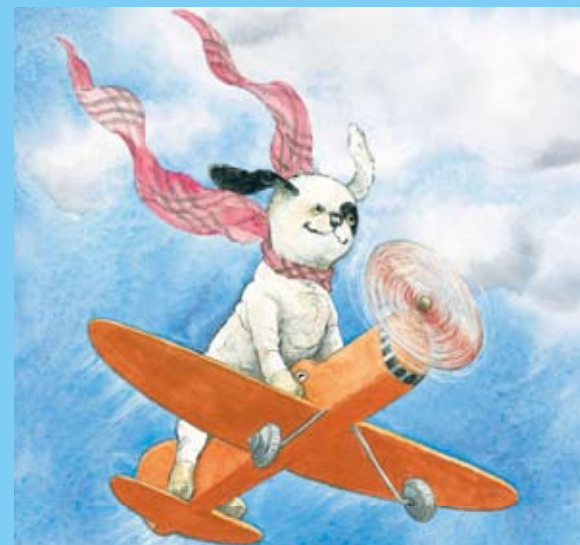
「とんでいきたいなあ」2010 BL 出版